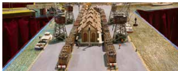
De Märklin Fan Club Italia viert “zijn” E 424 op een “424-dag”.