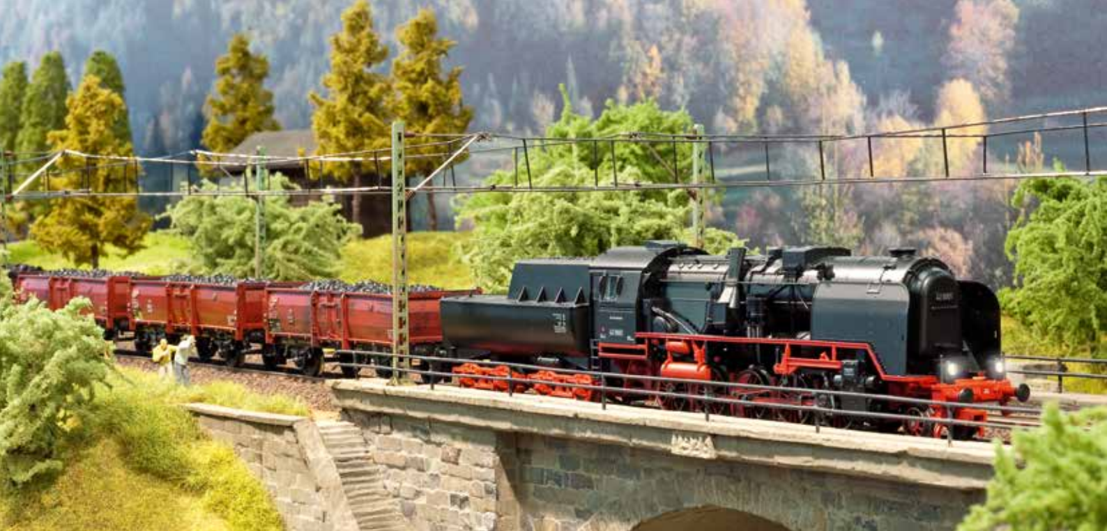
Sfeervol: De Franco-Crosti-stroomloc 429001 met de bedrijfsschoorsteen aan de zijkant passeert met een hele trein een brug.