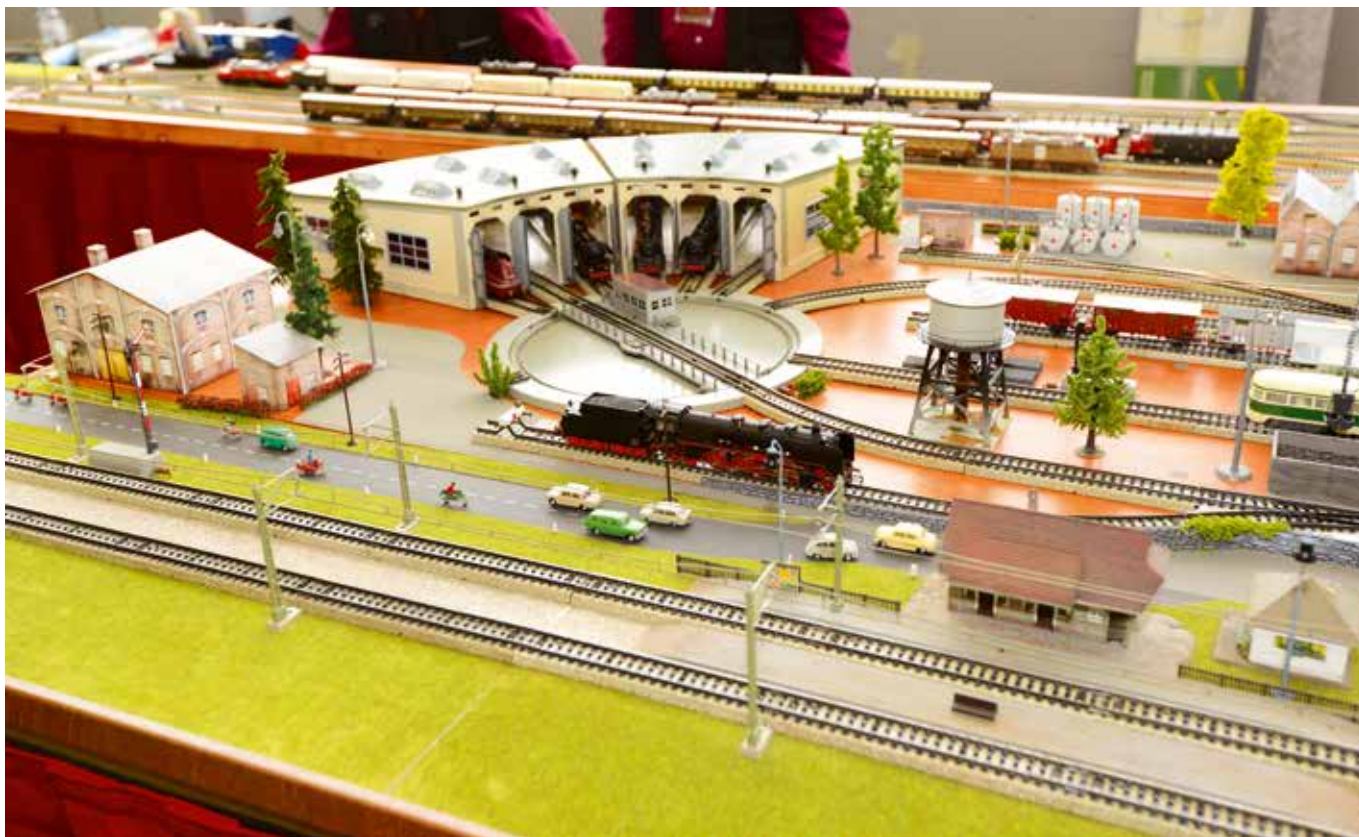
Modulebaan 2: De klassieke modelbaan hoort thuis in de periode van 1960 tot 1975. Ze herinnert aan Märklin-speelgoed dat iedereen had, of graag had gehad.