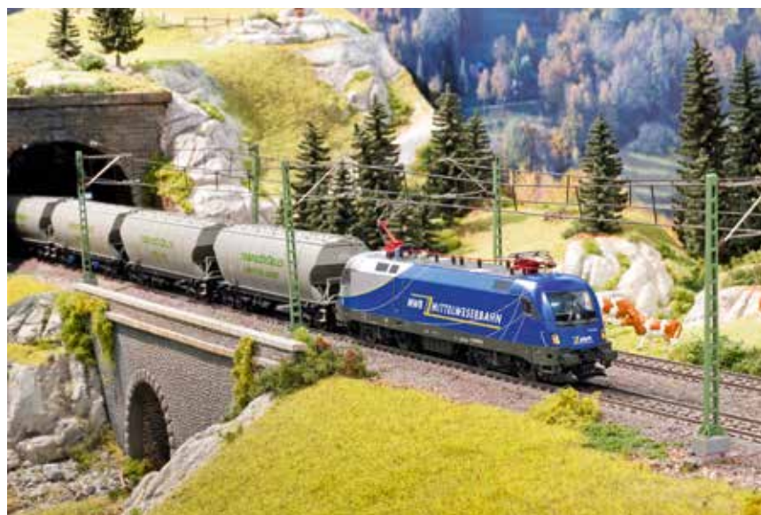
Modulebaan 1: Op de digitale modelbaan laten de Märklinisti-landschapvormgevers hun fantasie de vrije loop en er wordt gereden met alles wat plezier oplevert.