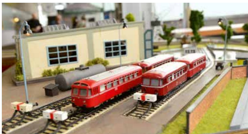
Rencontre d'autorails : le réseau vintage puriste met les modèles bien en valeur.