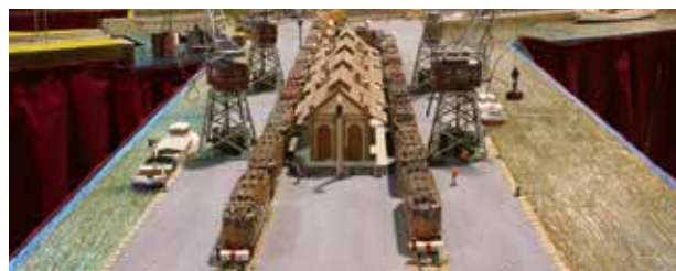
Le Fan Club Märklin Italia fête « sa » E 424 lors d'une « journée de la 424 ».

Texte : Rochus Rademacher