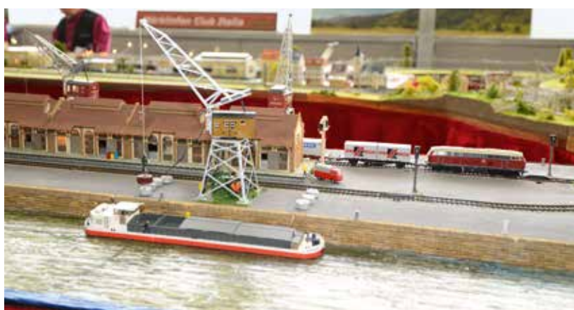
Jeux d'eau : centre de transbordement à l'interface entre le rail et l'eau.

→ uniquement via l'internet, les autres s'engagent pour la construction du réseau modulaire du club et les expositions.